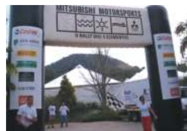
Rally Mitsubishi - RJ