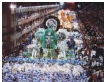
Carnaval - SP/RJ