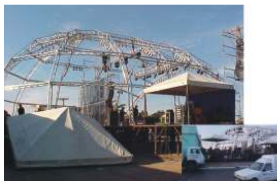
Gravação DVD da dupla Diego e Diogo em Cuiabá - MT