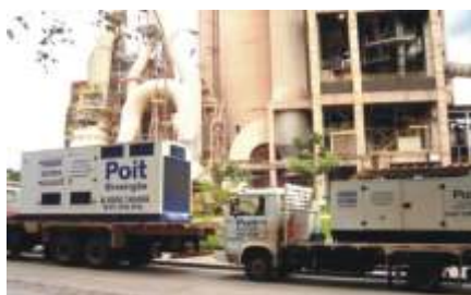
Atend. a Usina Cimenteira - GO