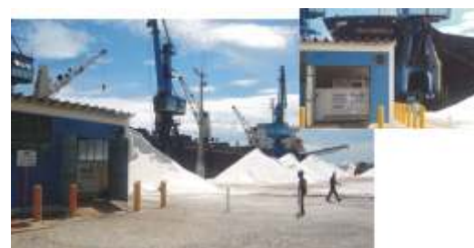
Atend. no Porto de Arraial do Cabo - RJ