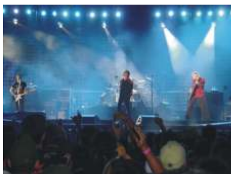
Show U2 - SP