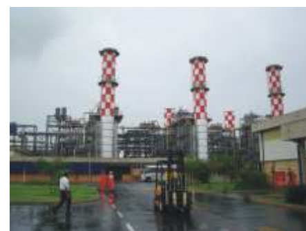
Usina Termo Fluminense - Macaé - RJ