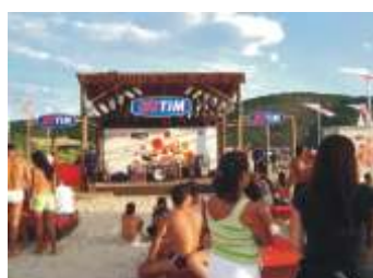
Projeto Verão TIM - RJ