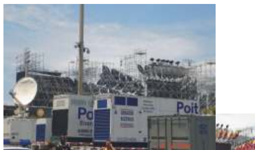
Show Rolling Stones - RJ