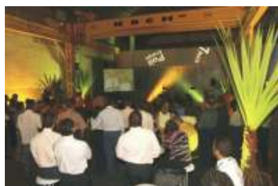
Aniversário Poit 7 anos - SP